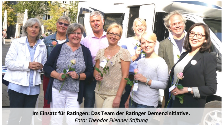
Im Einsatz für Ratingen: Das Team der Ratinger Demenzinitiative.

Gemeinsam haben Experten aus dem Fliedner Krankenhaus Ratingen nun einen spannenden Tag organisiert. Am 21. September geht es ab 13 Uhr mit einem lockeren Vortragsprogramm los, das durch interaktive Übungen und Angebote ergänzt wird. „Betroffene, Angehörige aber auch am Thema Interessierte sind herzlich eingeladen“, öffnet Gina Kuypers die Türen. Angesprochen werden Themen wie Diagnose Demenz, Familiäre Pflege oder die Bandbreite an Ratinger Hilfsangeboten. Eine Anmeldung ist nicht erforderlich, der Eintritt ist frei.